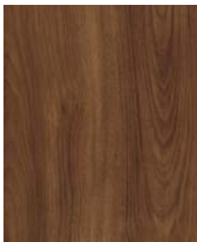
SANTA FÉ FC 7363-3