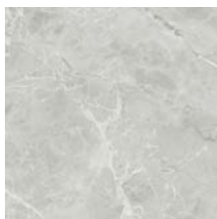
NEW YORK FC 23048-3