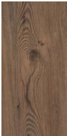
DAKOTA DW 1371

Esse produto possui camada extra de poliuretano, o que proporciona mais proteção e resistência contra riscos e manchas.