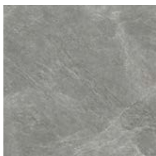
OREGON AM 5392