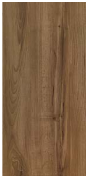
TEXAS DW 7003