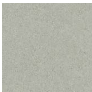
NEBRASCA AA 7371

Garantia: 10 anos para uso Residencial e 5 anos para uso Comercial