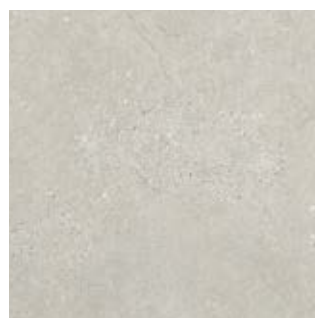
HOUSTON FC 23076-3