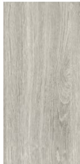
ALASKA EW 3081