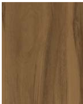
TUCSON M 1054-3