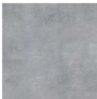
BIG CALIFÓRNIA* DT 6601-2