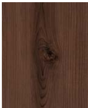
LAS VEGAS FC 6006-9