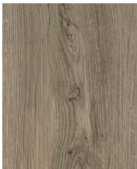
SEATTLE M 1022-3