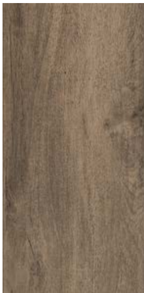
FLÓRIDA D 22