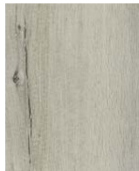
DENVER M 1065-1