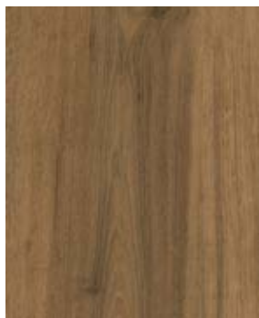
KANSAS XJ 82003-6