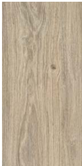
MONTANA DTF 002